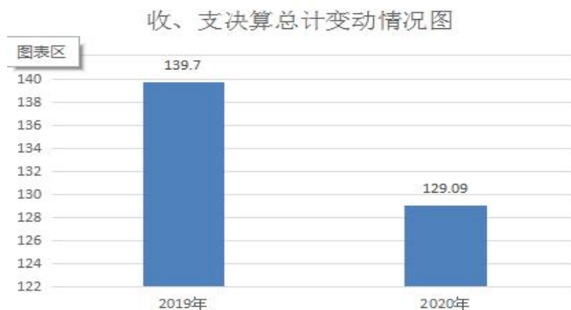
图1：收、支决算总计变动情况图

2020年度收、支总计129.09万元。与2019年139.70万元相比，收、支总计各减少10.61万元，下降8.22%。主要变动原因是收入减少。