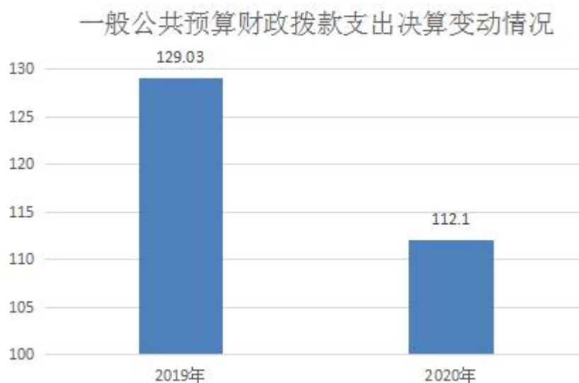
图 5：一般公共预算财政拨款支出决算变动情况