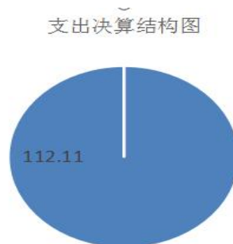
图3：支出决算结构图

2020年本年支出合计112.11万元，其中：基本支出112.11万元，占100.00%；项目支出0万元，占0%；上缴上级支出0万元，占0%；经营支出0万元，占0%；对附属单位补助支出0万元，占0%。