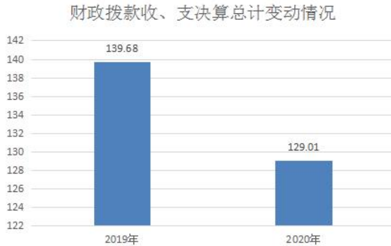
图4：财政拨款收、支决算总计变动情况

2020年财政拨款收、支总计129.01万元。与2019年139.68万元相比，财政拨款收、支总计各减少10.67万元，下降8.27%。主要变动原因是收入减少。