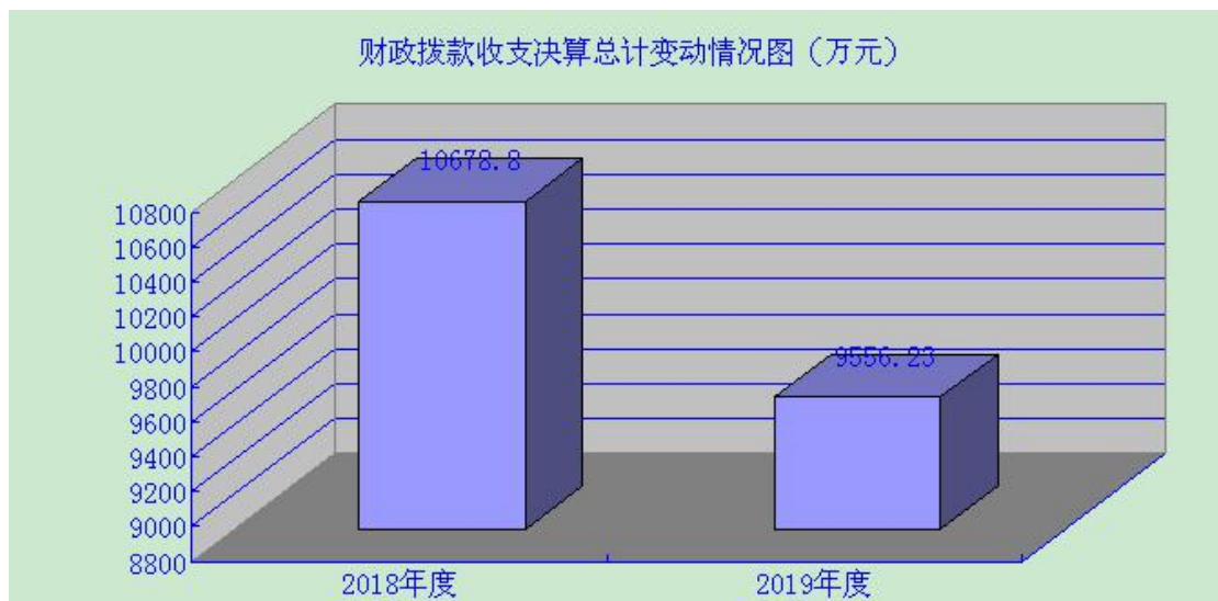
(图 4: 财政拨款收、支决算总计变动情况)

2019 年财政拨款收、支总计 9556.23 万元。与 2018 年相比,财政拨款收、支总计各减少 1122.57 万元,下降 10.51%。主要变动原因一是 2019 年 3 月部分人员分流至其他市级各