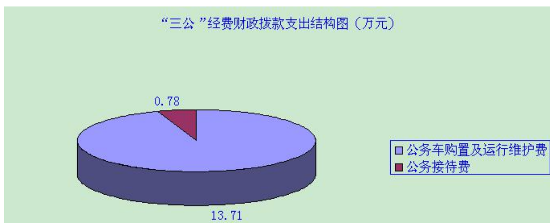
(图 7：“三公”经费财政拨款支出结构)