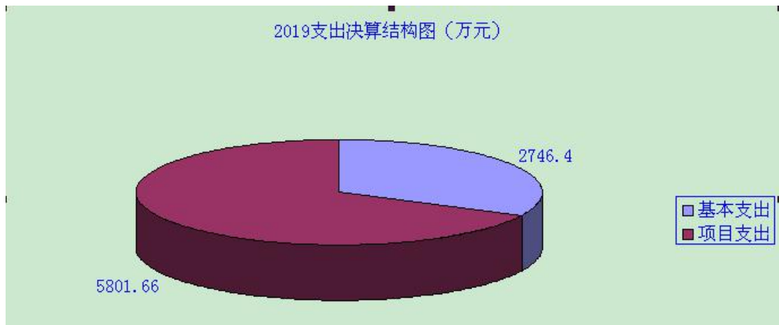
(图 3: 支出决算结构图)