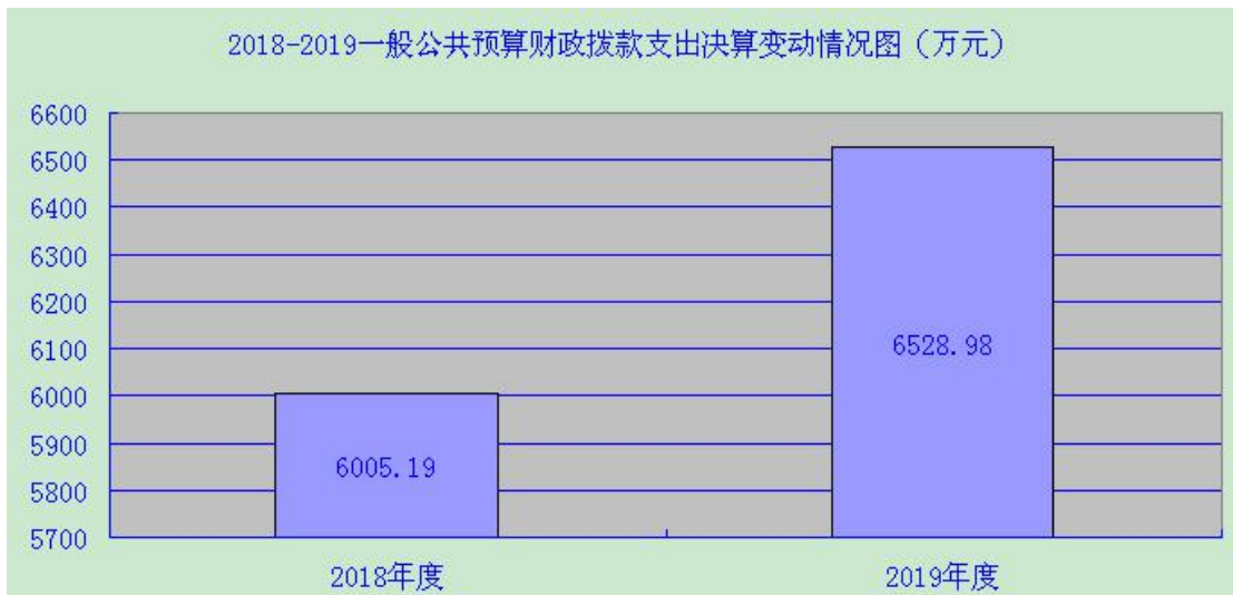
（图5：一般公共预算财政拨款支出决算变动情况）

2019年一般公共预算财政拨款支出6528.98万元，占本年支出合计的68.32%。与2018年相比，一般公共预算财政拨款增加523.79万元，增长8.72%。主要变动原因是机构改革后单位职能职责增加，一般公共预算财政拨款增加。