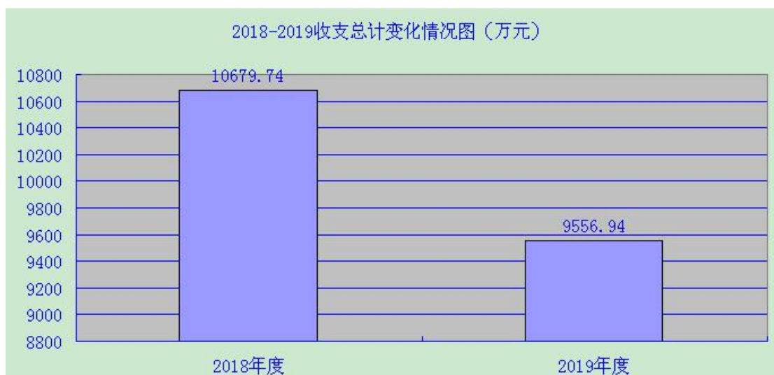
(图 1：收、支决算总计变动情况图)

2019 年度收、支总计 9556.94 万元。与 2018 年相比，收、支总计各减少 1122.80 万元，下降 10.51%。主要变动原因一是 2019 年 3 月部分人员分流至其他市级各部门，人员经费相应减少；二是城管体制改革，事权下沉至区（县），市政等工程项目经费减少。