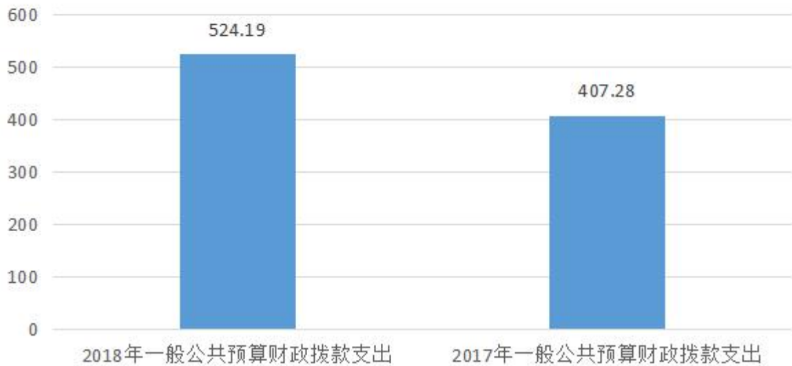
图5：一般公共预算财政拨款支出 决算变动情况