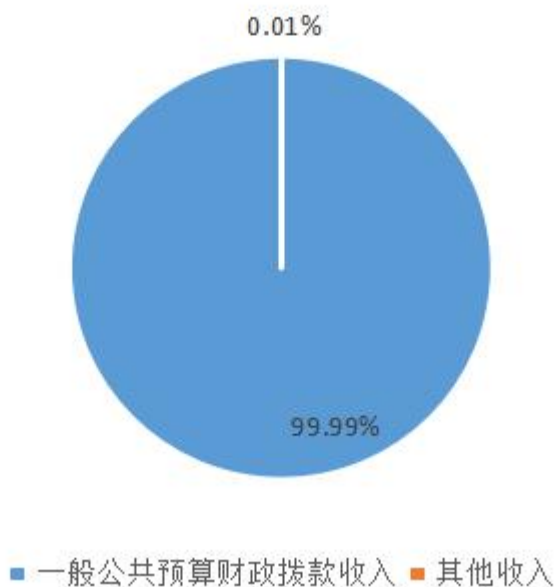
图2：收入决算结构图

2018年本年收入合计524.18万元，其中：一般公共预算财政拨款收入524.17万元，占99.99%；其他收入0.01万元，占0.01%。