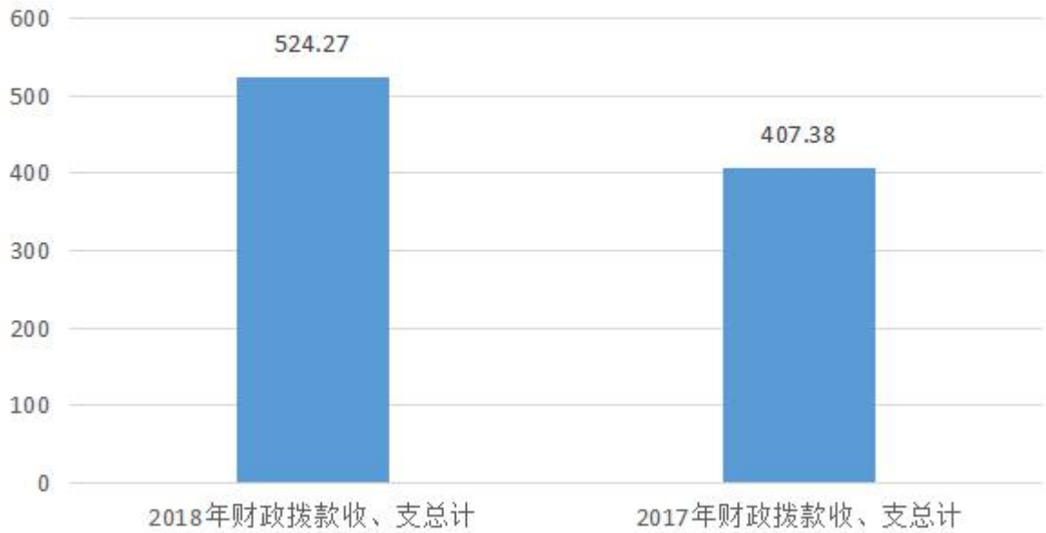
图4：财政拨款收、支决算总计变动情况