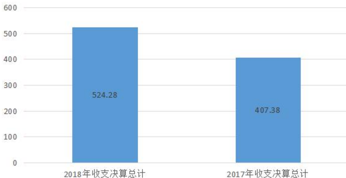
图1：收、支决算总计变动情况图