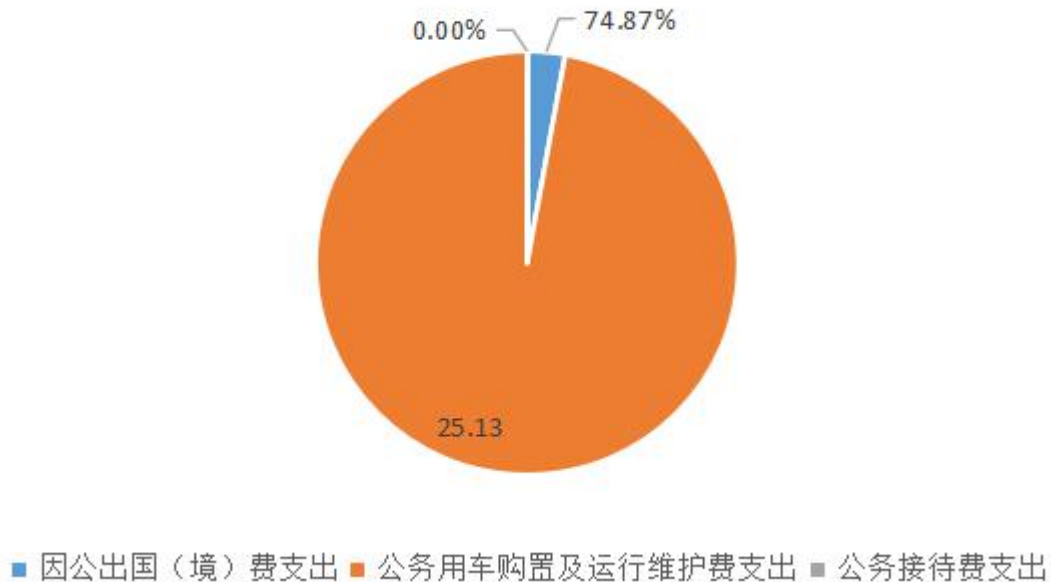
图7：“三公”经费财政拨款支出结构

2018年度“三公”经费财政拨款支出决算中，因公出国（境）费支出决算38.47万元，占74.87%；公务用车购置及运行维护费支出决算12.91万元，占25.13%；公务接待费支出决算0万元，占0%。具体情况如下：