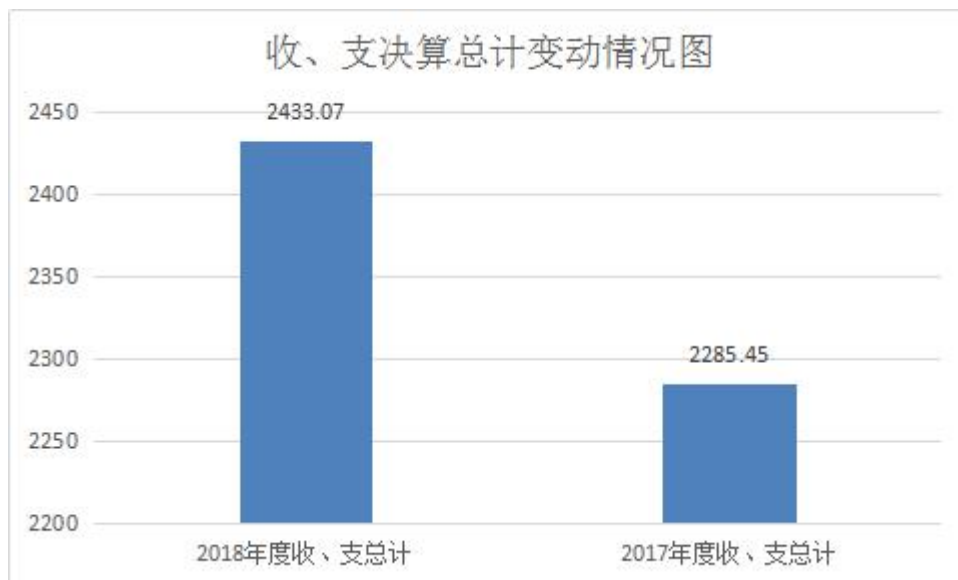
(图 1: 收、支决算总计变动情况图)

2018 年度收、支总计 2433.07 万元。与 2017 年相比，收、支总计各增加 147.62 万元，增长 6.46%。主要变动原因是：受资助的学生数人数增加。