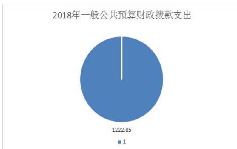
(图 6: 一般公共预算财政拨款支出决算结构)

2018 年一般公共预算财政拨款支出 1222.85 万元，主要用于以下方面: 教育支出 (类) 1222.85 万元，占 100%。