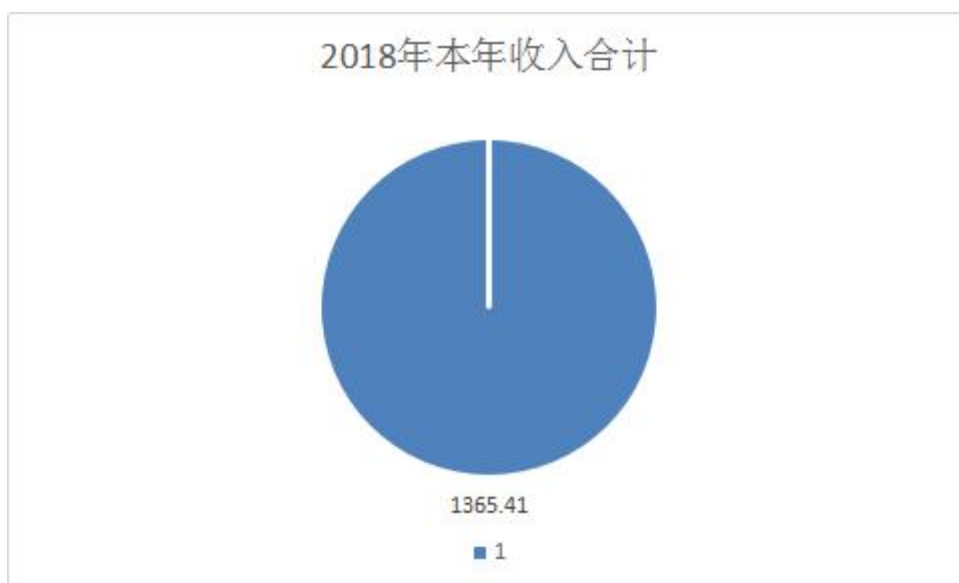
（图 2：收入决算结构图）

2018年本年收入合计1365.41万元，其中：一般公共预算财政拨款收入1365.41万元，占100%。