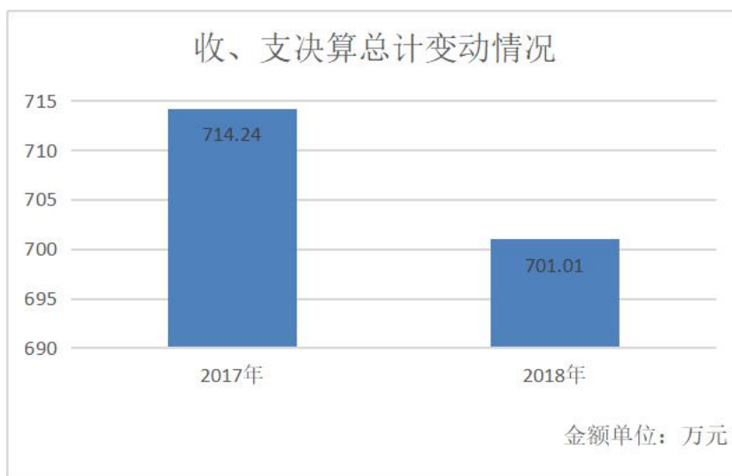
(图 1：收、支决算总计变动情况图) (柱状图)