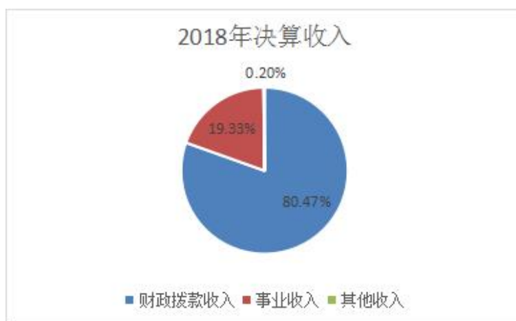
(图 2：收入决算结构图) (饼状图)

2018 年本年收入合计 625.98 万元，其中：一般公共预算财政拨款收入 503.74 万元，占 80.47%；事业收入 121 万元，占 19.33%；其他收入 1.24 万元，占 0.20%。