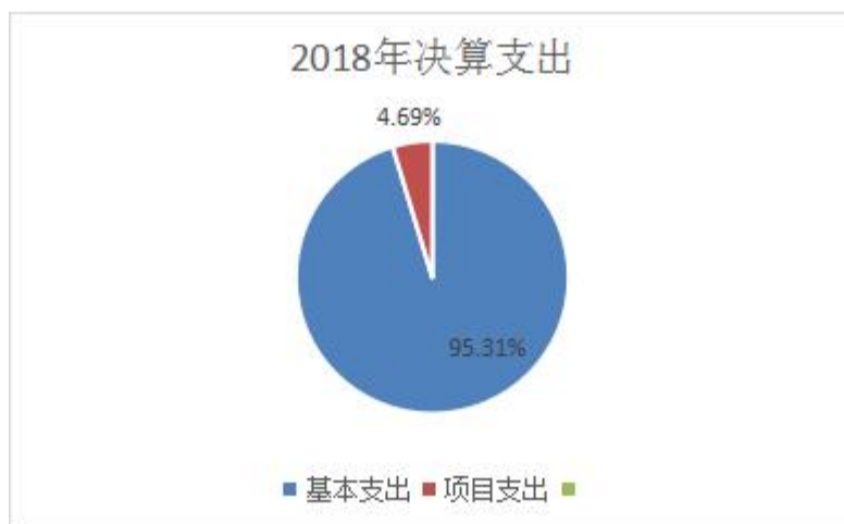
（图 3：支出决算结构图）（饼状图）

2018 年本年支出合计 588.47 万元，其中：基本支出 560.89 万元，占 95.31%；项目支出 27.58 万元，占 4.69%。